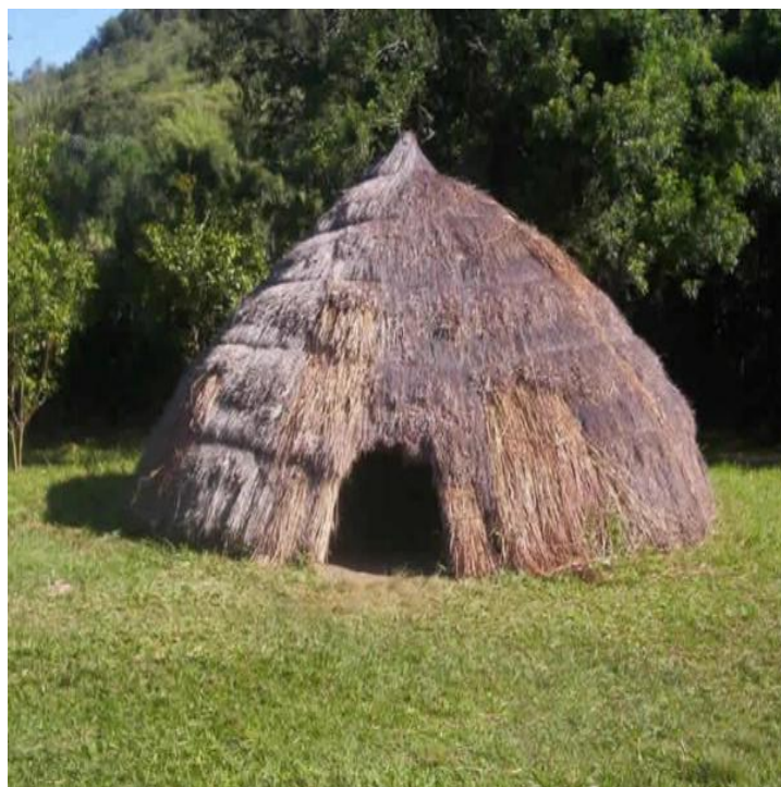
Figura 1. Kuarup - Habitação tradicional indígena.

Portanto, estudar e reconhecer os povos originários é um passo essencial para construir uma sociedade mais justa, inclusiva e consciente de sua diversidade cultural. A Figura 1 representa um modelo de habitação tradicional indígena.