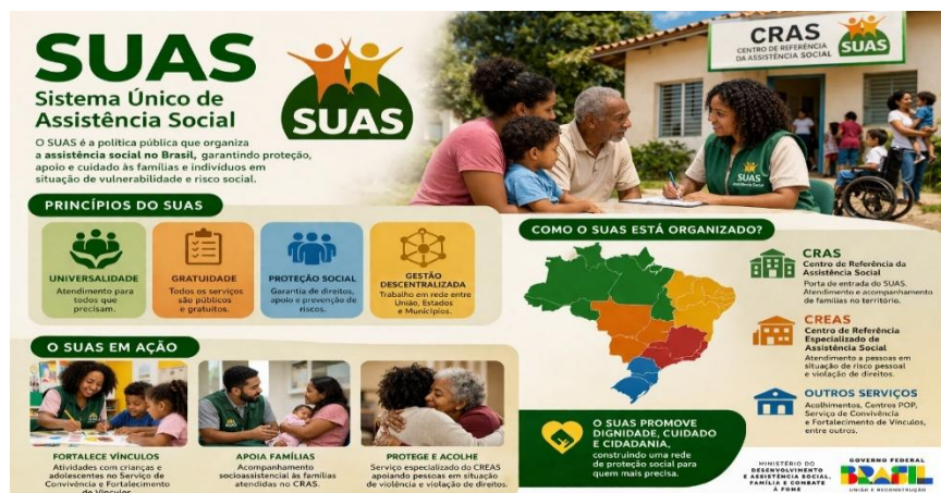
Imagem 2. Sistema Sistema Unico de Assistência Social